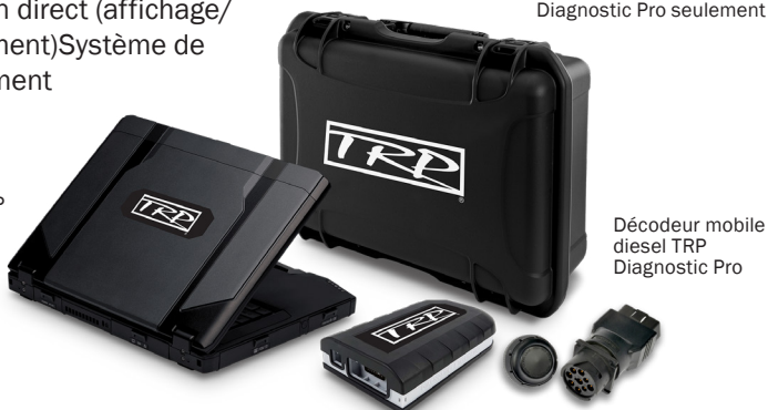
Ordinateur portable TRP Diagnostic Pro seulement